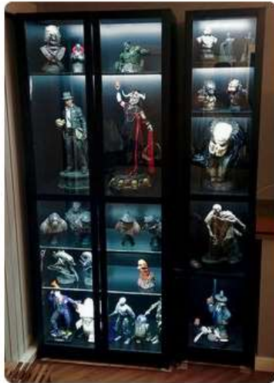
Lights for Detolf - Page 42