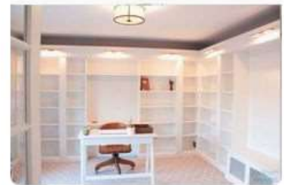
Office Makeover Part 2