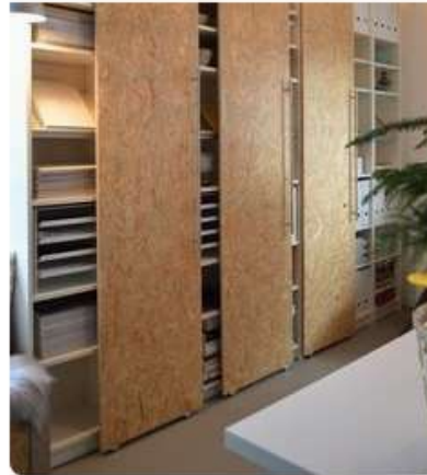
How To Hack Sliding Doors for IKEA BILLY Bookcases