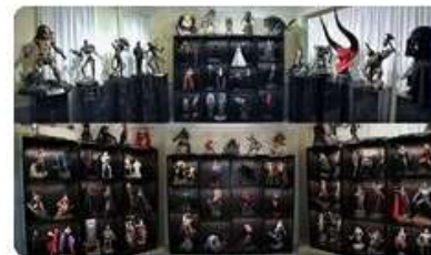
Billy bookcases with glass