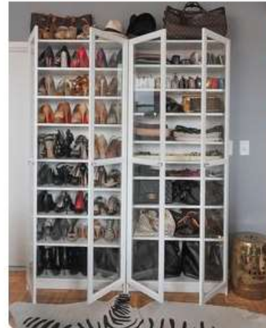
IKEA Billy Oxberg with glass doors for shoes and accessories