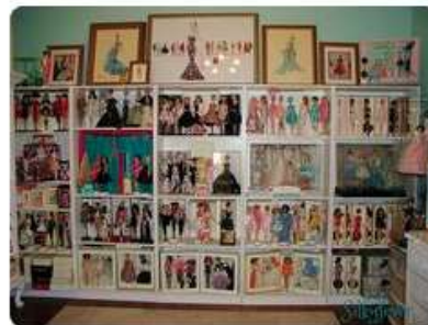
Barbie Display Wall - 2015 Version